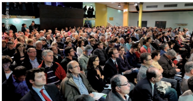
12 réunions en comités techniques, 20 en comités de pilotage et plusieurs réunions publiques ont été organisées sur la ligne 18 depuis le lancement du projet du Grand Paris Express.

Plus de 350 réunions bilatérales se sont également tenues avec les acteurs du territoire de la ligne 18 : communes et communautés d'agglomérations, universités, laboratoires, entreprises, etc.